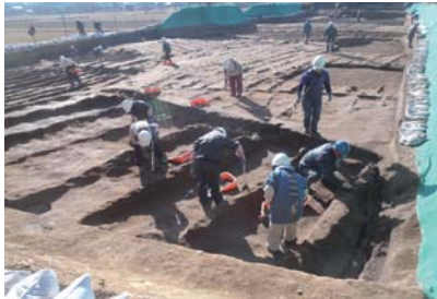
大島田 II 遺跡