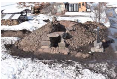
川場 46 号古墳